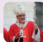
Lettera del Cardinale Pierbattista Pizzaballa, Patriarca di Gerusalemme dei Latini, in occasione di Melzo Incontra.

In quest'ottica, la vostra iniziativa educativo-culturale intende essere un luogo di raduno in cui ricevere energie, come da una "vela" spiegata che raccoglie il benefico soffio dello Spirito. Convogliando il pensiero di scrittori e di artisti volete solcare le onde del pensiero contemporaneo e arrivare a sicuri porti di approdo per dare stabilità e fiducia ai giovani.